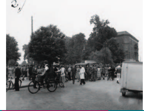
Demonstranten auf dem Karl-Marx-Platz (heute Schleusenplatz) am 17. Juni 1953. Einer der Hauptredner, der vom MFS gesucht wurde, konnte mit Hilfe von Bekannten nach West-Berlin flüchten.