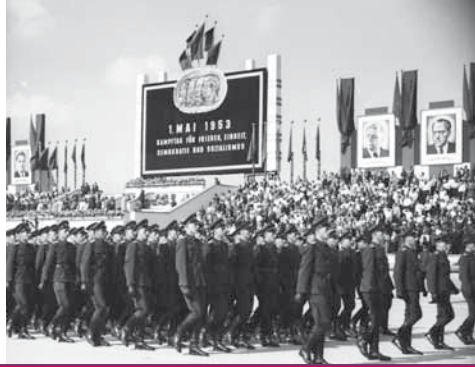
Parade der Kasernierten Volkspolizei am 1. Mai 1953 in Ost-Berlin.