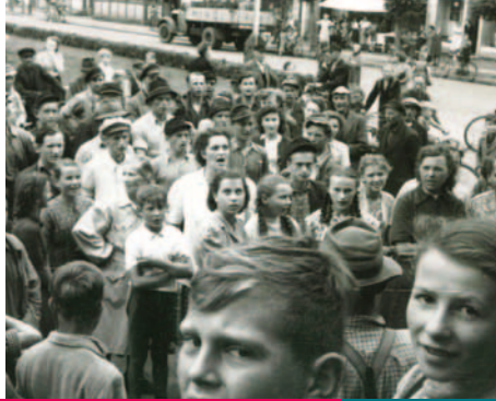
Einwohnerinnen von Wusterhausen/Doose mit ihren Kindern am Rande der Demonstration, Fotograf: Schulz, Privatsammlung Wirsam.