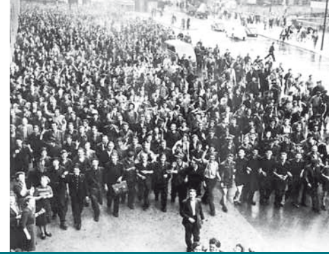
Mehrere tausend Arbeiter aus den Hennigsdorfer Großbetrieben demonstrierten durch West-Berlin zum Haus der Ministerien in Berlin-Mitte, BA.