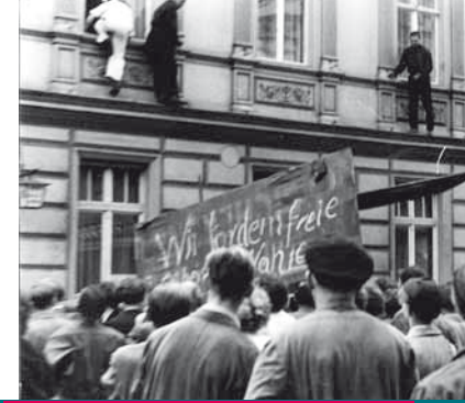
Das Kulturhaus der FDJ wurde gestürmt, Fotograf: Karl Friedrich Grasow, StArch Brandenburg an der Havel.