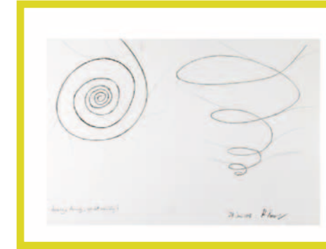
Irrweg, Ausweg, Wo ist mein Weg?