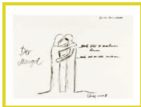
Schrei nach innerer Versöhnung