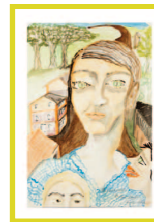
Verunsicherung und Zersetzung der Familie