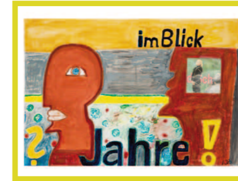
im Blick: Jahre!