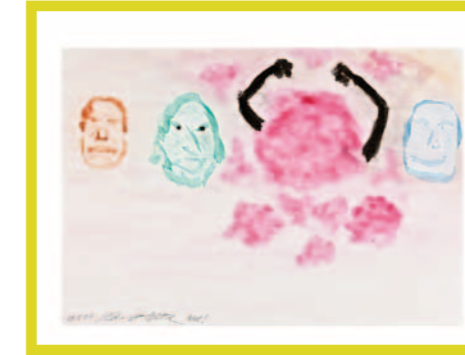
Wut - Die innere Befindlichkeit damals – heute